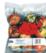
Сумка с прорезью.

Сумка по своей форме напоминает подушку. Сварной сплошной шов типа "зебра" делается поперѐк всего пакета. В верхней части пакета имеется прорезь для руки.